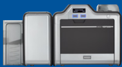
Impresora/codificadora de doble cara

HID Global introdujo la impresión de alta definición (HDP) en 1999 y hemos estado perfeccionando la tecnología desde entonces. La HDP5600 refleja nuestro compromiso a una innovación inspirada en los clientes y la evolución de nuestra familia de soluciones de Impresión de alta definición. Robustas y confiables, las impresoras/codificadoras de tarjeta HDP5600 de quinta generación de HID Global ofrecen la calidad de impresión con la que puede contar su organización y los avances tecnológicos que desea. Además, una confiabilidad de quinta generación significa mayor tranquilidad y menos tiempo muerto de impresión, y debido a que la cabeza de impresión nunca entra en contacto con las superficies de las tarjetas o desechos, nunca se daña en el proceso de impresión. De hecho, cuenta con una garantía vitalicia.